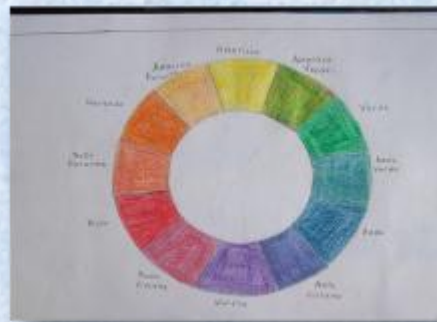
Clasificación de colores.

A pesar de esto dentro de los procesos educativos analizados se dieron intentos superficiales de promover modos de construcción de imágenes innovadores. Y un caso, el de Laura, en el que predominaron propuestas que impulsaron la creatividad.